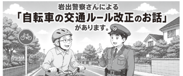
岩出警察さんによる 「自転車の交通ルール改正のお話」 があります。