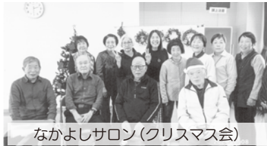
なかよしサロン(クリスマス会)

なかよし会は、月に1回なかよしサロンを開催しています。当サロンでは、4月に花見会を開催する予定です。最近、新規参加者がありました。皆さんも、なかよしサロンで友達作りをしませんか! ◎開催日時▶3月14日(金) 午後1時30分～3時30分