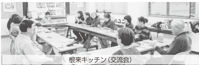
根来キッチン(交流会)

なかよし会は、根来キッチンで料理関係の交流会を行いました。多数の参加者があり、楽しい交流会でした。最近、新規参加者もありました。皆さんも、根来キッチンに参加して、楽しく料理を作りませんか! ◎開催日時▶3月15日(土) 午後1時30分～3時30分